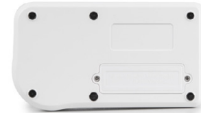
Vista posteriore, coperchio del vano batterie avvitato